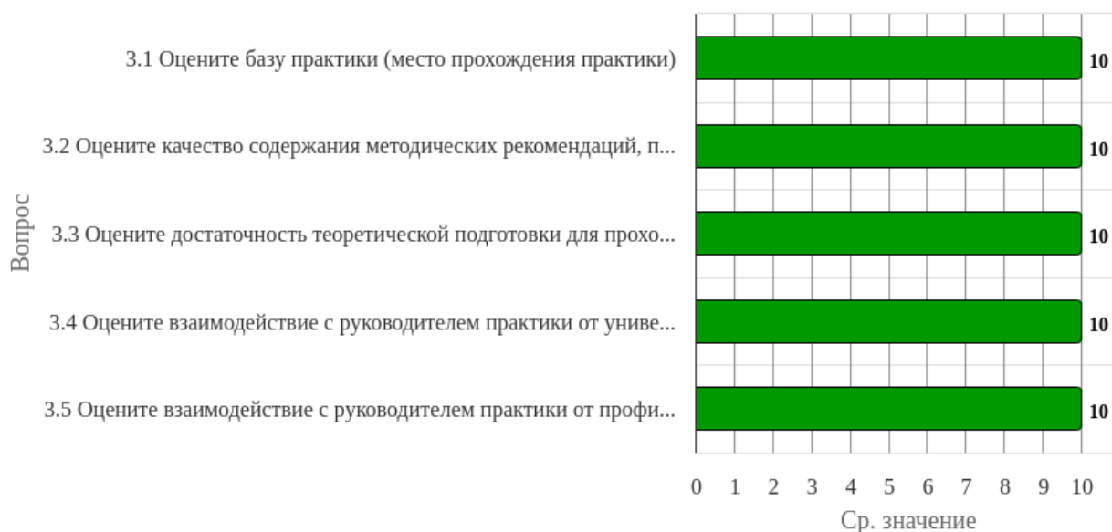
Рисунок 2.3.1 - Распределение показателей уровня удовлетворенности всех респондентов по блоку вопросов «Удовлетворенность практической подготовкой при прохождении практики»

Индекс удовлетворенности по блоку вопросов «Удовлетворенность практической подготовкой при прохождении практики» равен 10.