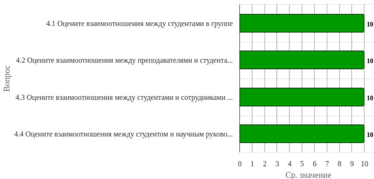
Рисунок 2.4.1 - Распределение показателей уровня удовлетворенности всех респондентов по блоку вопросов «Удовлетворенность взаимоотношениями в коллективе»

Индекс удовлетворенности по блоку вопросов «Удовлетворенность взаимоотношениями в коллективе» равен 10.