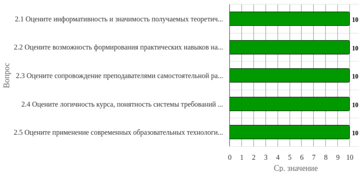
Рисунок 2.2.1 - Распределение показателей уровня удовлетворенности всех респондентов по блоку вопросов «Удовлетворенность содержанием изученных дисциплин»

Индекс удовлетворенности по блоку вопросов «Удовлетворенность содержанием изученных дисциплин» равен 10.