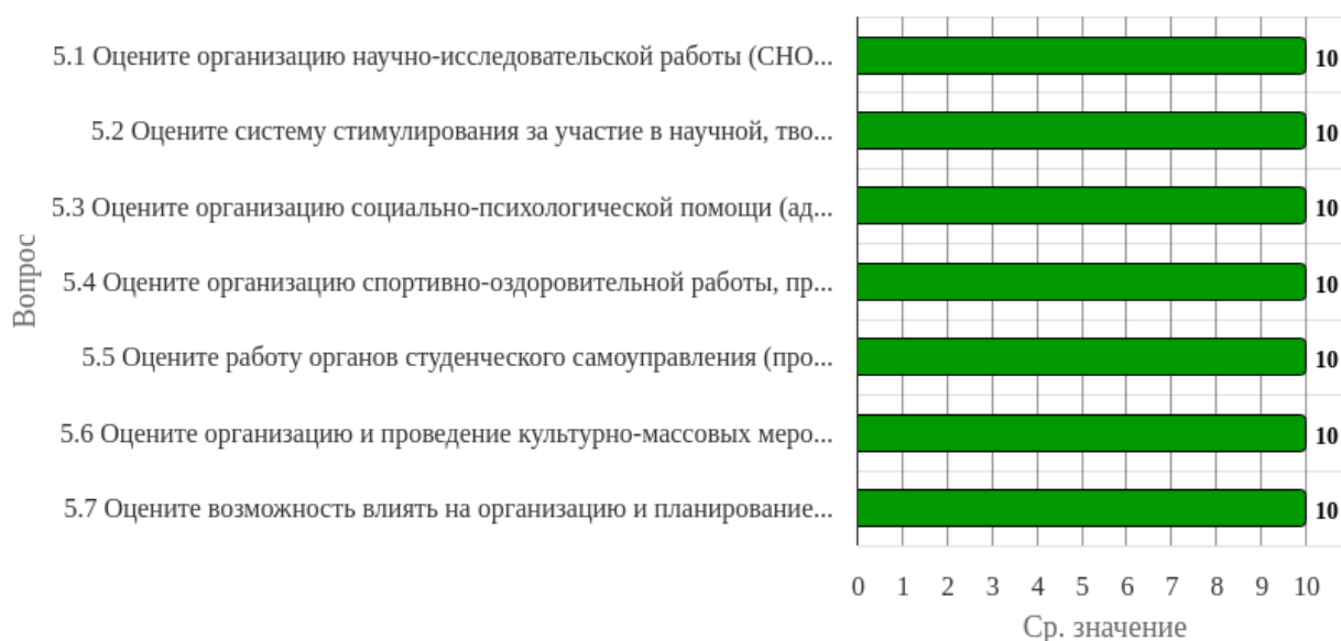
Рисунок 2.5.1 - Распределение показателей уровня удовлетворенности всех респондентов по блоку вопросов «Удовлетворенность организацией внеучебной деятельности»

Индекс удовлетворенности по блоку вопросов «Удовлетворенность организацией внеучебной деятельности» равен 10.